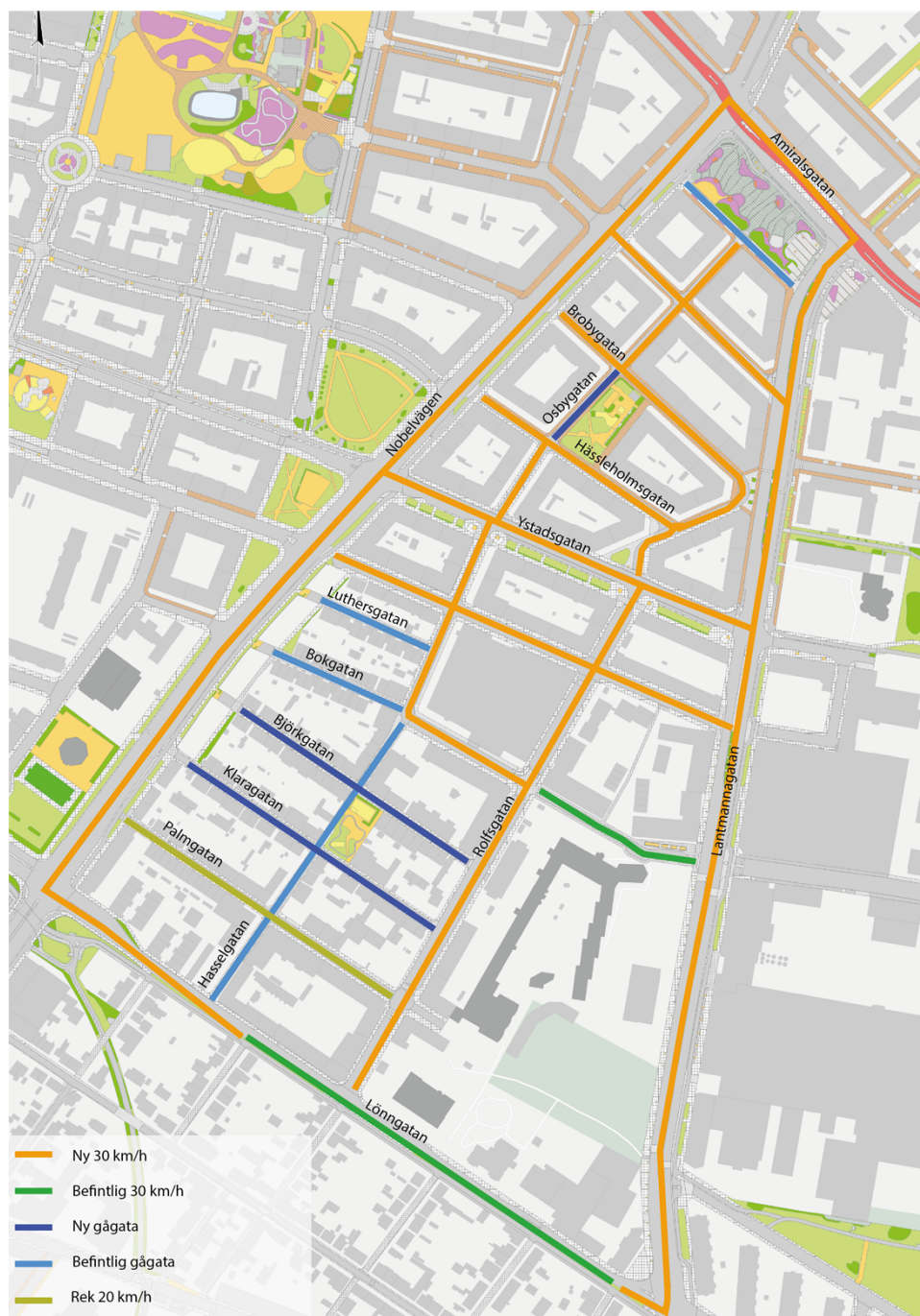
Figur 2. Kartan visar hur förvaltningens förslag om införande av 30 km/h förhåller sig till befintliga hastigheter och förslag på nya regleringar i området.

området till dessa platser, samt till de nya vistelsezoner som ska upprättas. Då barn har svårt att bedöma bilars hastighet och höga hastigheter bidrar till högre olycksrisk och otrygghet, förordas en hastighetsbegränsning på 30 km/h på de gator som inte blir gånggator. Idag är det bara intill grundskolorna som det finns en hastighetsbegränsning till 30 km/h, samt på Nobelvägen vid en olycksdrabbad korsning. En sänkt hastighet leder till ett lägre trafiktempo inom området, vilket bidrar till att öka vistelsekvaliteterna, trafiksäkerheten och trafiktryggheten.